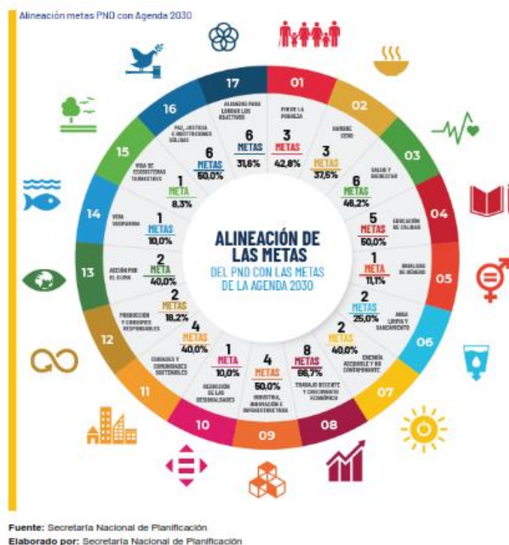
Ilustración 5 Alineación de las metas

Fuente: Secretaría Nacional de Planificación Elaborado por: Secretaría Nacional de Planificación