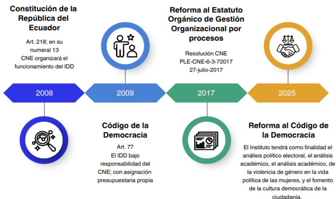
Ilustración 1 Línea histórica de la institución – IDD