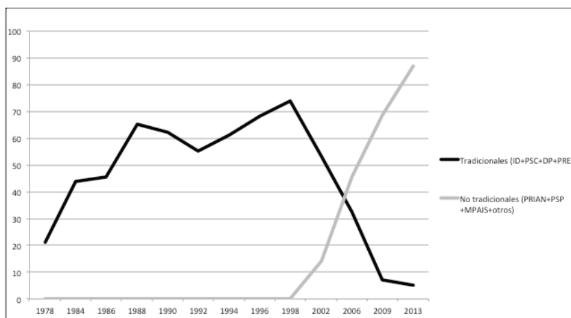
Gráfico N° 1 Apoyo a partidos tradicionales vs. no tradicionales en la Asamblea Legislativa en Ecuador 1978-2013